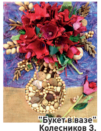
"Букет в вазе"