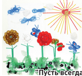
"Пусть всегда будет солнце"

В феврале ОАО «Мусороуборочная компания» объявило конкурс «КАРТИНКИ ИЗ МУСОРНОЙ КОРЗИНКИ», в условиях которого необходимо было до 1 мая изготовить панно из отходов. На протяжении нескольких месяцев сотрудники нашей компании, воспитанники детских садов, воспитатели, ученики различных школ, учителя, студенты и просто жители Краснодарского края приносили свои работы. Надо отметить, что все картины выполнены очень оригинально, интересно и красиво. Порой, даже удивляешься, насколько необычно можно использовать вещь, которую ты просто выкидываешь каждый день в контейнер. От всей компании мы благодарим участников конкурса и в очередном выпуске нашей газеты публикуем новые работы. Напоминаем, что голосование за лучшую работу продлится до 1 июня на официальных страницах и группах ОАО «Мусороуборочная компания». Награждение и выставка работ пройдет в июне в день, приуроченный к празднованию Всемирного дня окружающей среды.