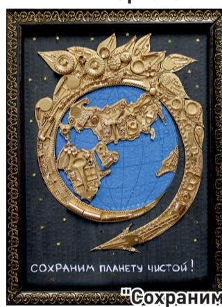
"Сохраним планету чистой"