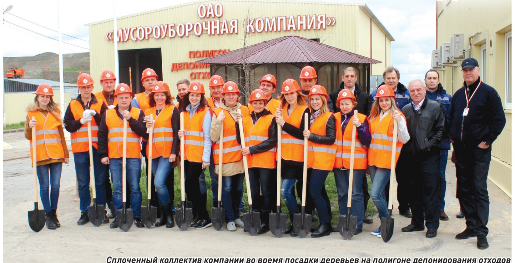
Сплоченный коллектив компании во время посадки деревьев на полигоне депонирования отходов

Первомайские гулянья на Руси начались еще со времен Петра I. Именно со времен его правления Сокольники перестали быть местом царской охоты, а стали любимым местом загородных прогулок москвичей. Особенным событием здесь было празднование 1-го Мая, так как именно в этот день собиралась практически вся Москва.