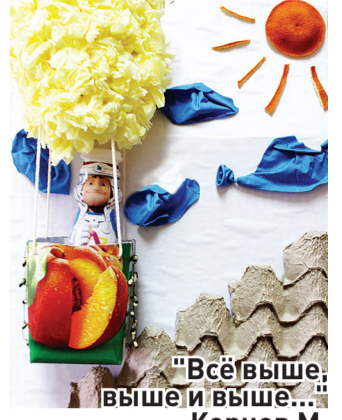
"Все выше, выше и выше..."